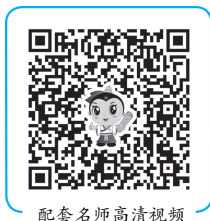
配套名师高清视频

6.治疗:①病原菌不明首选 三代头孢 ;②肺炎球菌、脑膜炎双球菌首选 青霉素 ;③大肠杆菌首选 三代头孢 ;④有脑水肿尽早使用 糖皮质激素 。